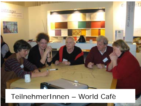
TeilnehmerInnen – World Café

In Kürze erscheint eine Tagungs-DVD mit den Beiträgen der Referenten. Für Euro 20.- zu beziehen bei r.plum@new-ethics.com .