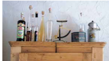
„Hausaltar“ von Frau A